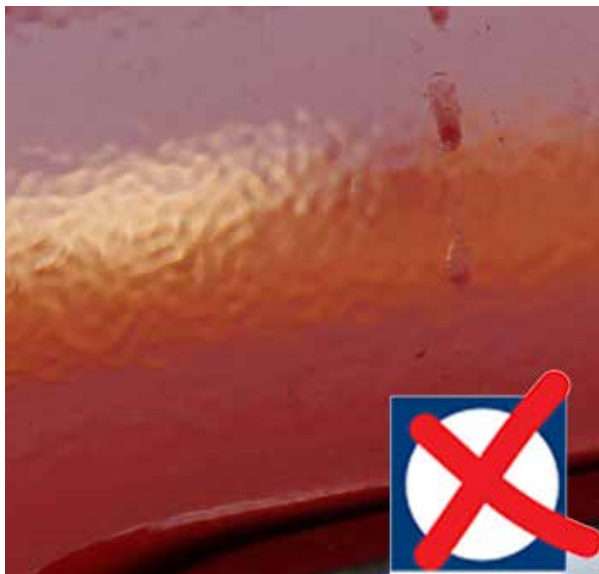
Slechte lakherstelling, sinaasappelpatroon en lopers.