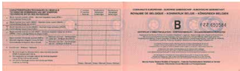
Inschrijvingsbewijs vanaf 1 september 2013

Inschrijvingsbewijs 2011- september 2013